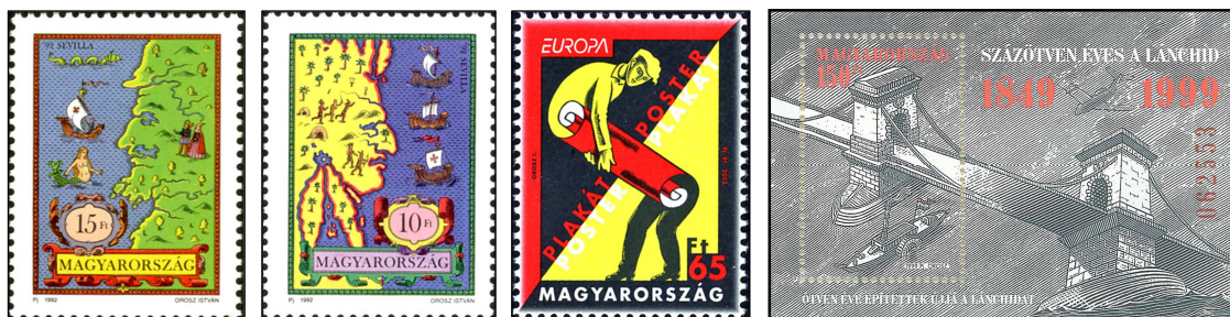
Drie geweldige ontwerpen van de Hongaarse graficus István Orosz. De eerste twee postzegels maken deel uit van een serie van vier unieke zegels met een optische verwisseling. Op het blokje heeft István Orosz een onmogelijke constructie getekend.

gegeven. De auteur maakt er een spannend verhaal van en brengt de lezers op de hoogte van het verschijnsel van de anamorfose. Ook neemt hij de lezer mee naar het leven van de kunstenaar. Er is een Engelse vertaling van dit interessante boek in voorbereiding. Voor verzamelaars van postzegels in thematische collecties een aantrekkelijk onderwerp om zich te verdiepen in het werk van verschillende kunstenaars, die fascinerende kunst ontwerpen en vervaardigen en waarvan hun werk op postzegels wordt afgebeeld. Kunstenaar István Orosz heeft ook zelf verschillende postzegels voor de Hongaarse Post mogen ontwerpen. Voor het thema Kunst op postzegels of het thema Optische Illusies op postzegels is zijn er meerdere filatelistische uitgaven beschikbaar. Bij een keuze voor kunst op postzegels kan de verzamelaar zich specialiseren in bepaalde kunststromingen om de hoeveelheid aangeboden nieuwe postzegels financieel aantrekkelijk te houden.